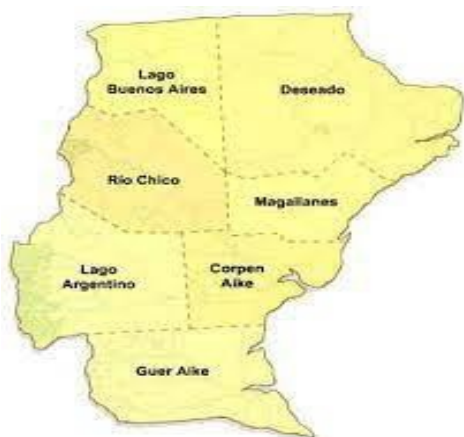
Fig 1: Departamentos de Santa Cruz Asentamientos urbanos y rurales

Güer Aike (Río Gallegos). Superficie: 3.402.831 ha