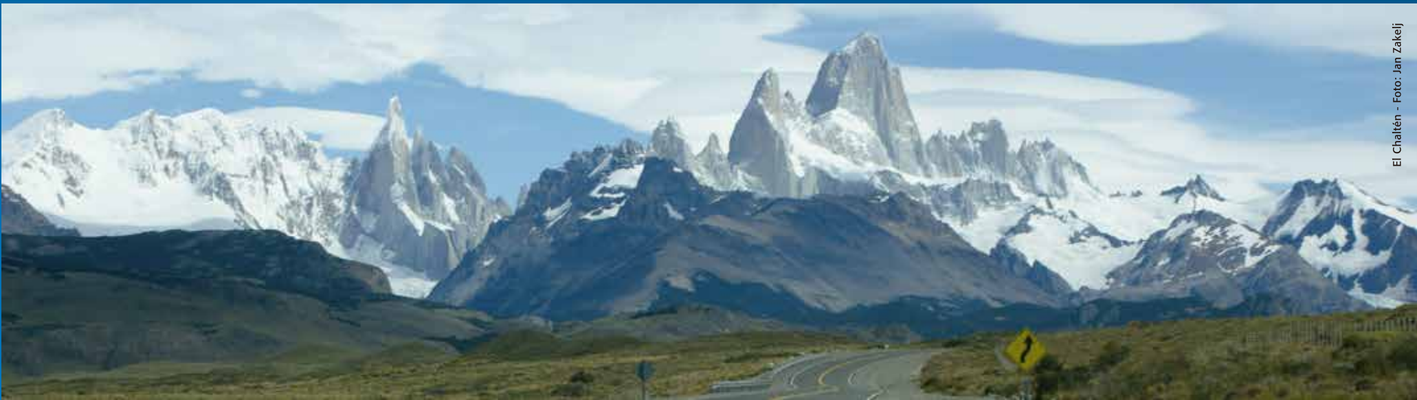
El Chaltén

Continuando el trazo de la ruta 40 pero desviándose por la ruta N° 37 se puede acceder al solitario Parque Nacional Perito Moreno, distante a 229 km de Gobernador Gregores. Situado en una región montañosa, con una nutrida fauna y vegetación, sitio ideal para el trekking y las cabalgatas. Un poco más al norte, la ruta provincial N°39 accede a Lago Posadas, cuyo principal atractivo son los lagos Pueyrredón y Posadas, impactan por lo profundo y acentuado de sus colores, azul y turquesa. Un lugar donde se puede disfrutar del paisaje y de las actividades al aire libre, ya que hay campings y cabañas preparadas para recibir al turista y permitirle una contacto pleno con la naturaleza. Toda la zona es inigualable para aquellos que amen la fotografía, la serie de cascadas y chorrillos ubicados cerca de los lagos, ofrecen un espectáculo poco visto, y los alrededores son ideales para practicar trekking, ascensiones y pesca deportiva.