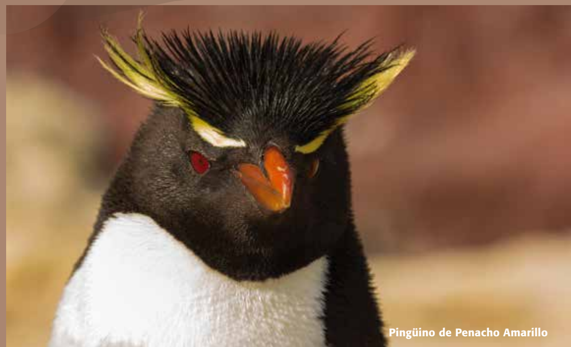
Pingüino de Penacho Amarillo