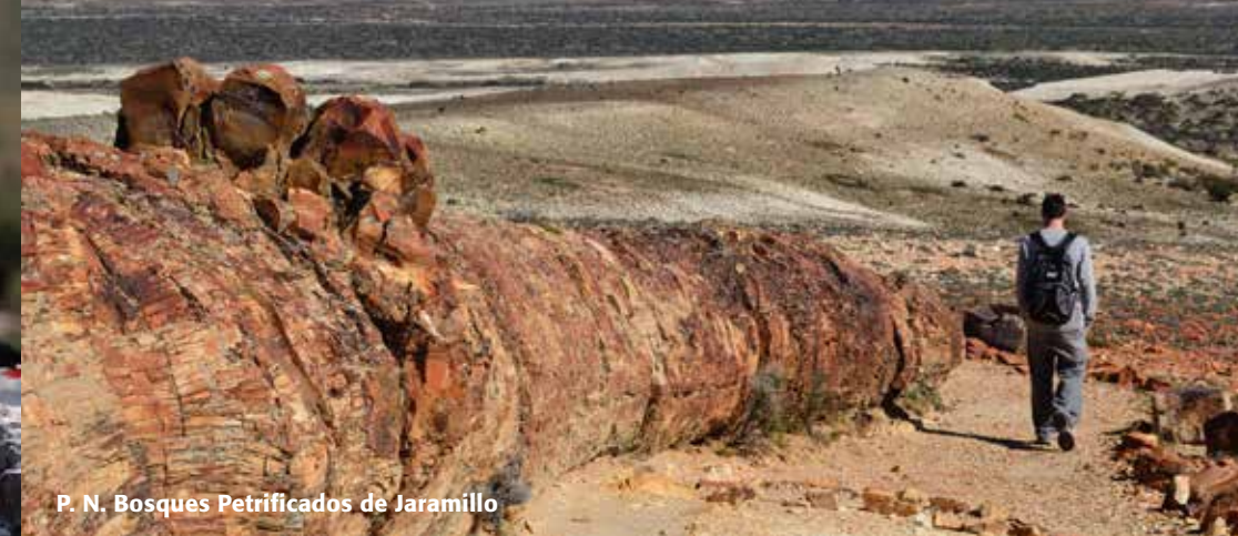
P. N. Bosques Petrificados de Jaramillo