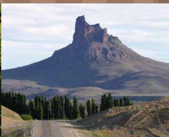
Cerro Ventana - Gob. Gregores